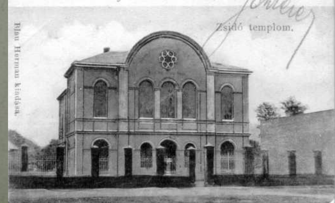
Milan Hermann kiadása.